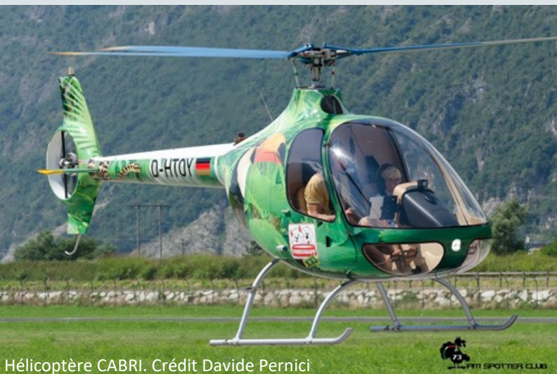
Hélicoptère CABRI.