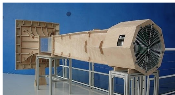
Fig.6– Le premier exemplaire d'EOLIA en 2006 à l'ISAE-ENSMA de Poitiers

*l'ISAE-ENSMA forme des ingénieurs pour la recherche et l'industrie aéronautique.