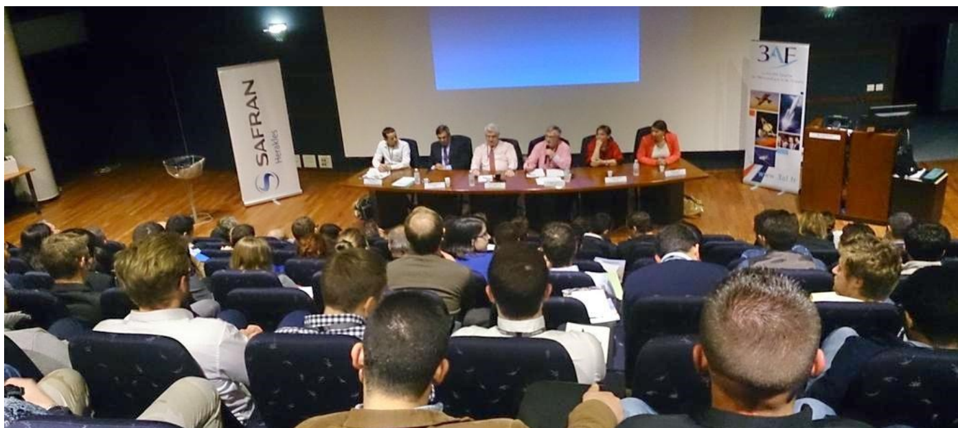
Fig. 4 - 6ème édition du Carrefour Jeunes organisé au sein de la société Safran Herakles en Nouvelle-Aquitaine en novembre 2014, avec pour thème : « Vie professionnelle, décollage imminent »

Rallye PME : sur une ou deux journées, on concentre un maximum de visites de PME (d'une à deux heures chaque) pour des étudiants répartis par petits groupes, qui se succèdent dans chaque entreprise. A l'issue, les étudiants répondent à un questionnaire pour confirmer l'assimilation des informations. Le choix de présenter des PME, moins connues des jeunes que les grands groupes (Airbus, Safran, Thales...) qui recrutent en continu de nombreux collaborateurs, aide à montrer aux étudiants qu'ils bénéficient d'une offre diversifiée pour des stages puis des postes ;