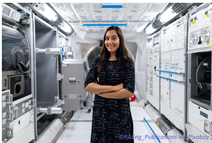
Fig.3 - Des contacts avec des ingénieurs expérimentés, des opportunités de stages, des visites de sites : les étudiants veulent plus d'occasions d'appréhender la réalité de leur futur métier, pour confirmer leur orientation professionnelle et choisir une spécialité.

Durant leur cursus ingénieur, des étudiants se tournent vers la 3AF à la recherche de contacts, notamment dans le domaine spatial où il peut être difficile de trouver un stage.