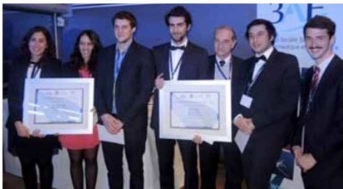
Fig.5– Les lauréats (1er prix) du concours « le bonheur est dans l'usine » 2014 : une équipe d'élèves ingénieurs des Arts & Métiers ParisTech. Ils ont gagné un séjour de quatre jours à New-York financé par ALCOA.

Le Bonheur est dans l'Usine : la PME française HOWMET/ALCOA a sollicité la 3AF, souhaitant se faire connaître des futurs jeunes actifs. Cette PME est spécialisée dans la fonderie par cire perdue de pièces en alliage destinées aux marchés de l'aéronautique et de l'énergie. L'initiative a permis de mettre en contact étroit à deux reprises, en 2014 et 2015, les étudiants avec le fonctionnement de cette PME. Principe : des problématiques variées (organisation, développement durable, satisfaction du personnel) sont soumises aux candidats, et l'industriel joue le jeu en leur donnant un accès privilégié à ses données de fonctionnement. Après une première phase d'analyse, les équipes participantes ont accès à l'usine avec la possibilité de poser toutes leurs questions pour orienter l'étude en cours ; elles concluent en présentant leurs réponses aux problématiques proposées, au bénéfice de l'entreprise. Les synthèses les plus pertinentes sont récompensées par un prix. « Le bonheur est dans l'usine » était le thème 2016 du concours.