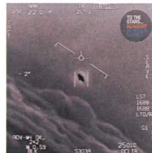
Vidéo infrarouge Gimbal publiée par TTSA

Pourtant, les incursions aériennes ou les manœuvres de rapprochement spatiales, comme les essais de missiles à propulsion nucléaire, sur fond de fin du traité INF, de déclarations des Présidents Trump et Putin, et de tensions entre USA et Iran, ne sont pas un nouveau roman de Tom Clancy sur les UFOs. Ils peuvent créer des confusions réciproques et intentionnelles entre sujets (what's up ? advanced air threat or UAP ?) pour les masquer ou les exhiber pour demander des crédits à l'heure des missiles hyper-soniques.